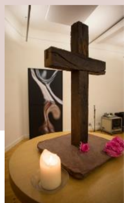
Meditation & Achtsamkeit

Die Academie IM AUSTAUSCH wird einmal pro Quartal exklusiv für unsere Mitglieder als Online-Veranstaltung über Zoom angeboten. Alle sind herzlich eingeladen, sich in diesem Rahmen über aktuelle Werte-Debatten zu informieren und auszutauschen. Der Einwahl-Link wird den Mitgliedern separat zugeschickt.