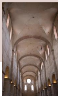
Führung & Werte