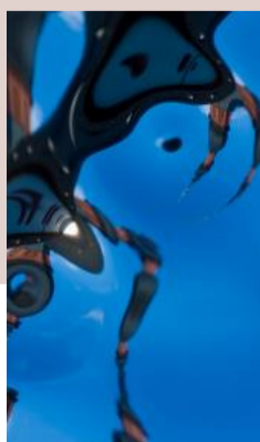
Spiritualität & Gesellschaft