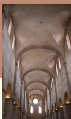
Führung & Werte