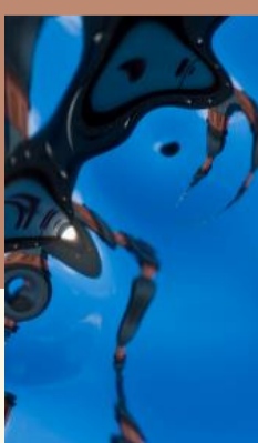
Spiritualität & Gesellschaft