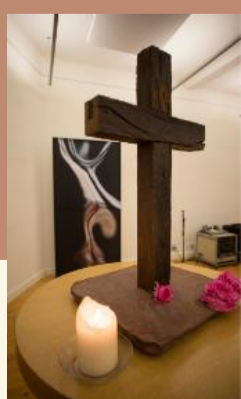
Meditation & Achtsamkeit

Die Academie IM AUSTAUSCH wird einmal pro Quartal exklusiv für unsere Mitglieder als Online-Veranstaltung über Zoom angeboten. Alle sind herzlich eingeladen, sich in diesem Rahmen über aktuelle Werte-Debatten zu informieren und auszutauschen. Der Einwahl-Link wird den Mitgliedern separat zugeschickt.